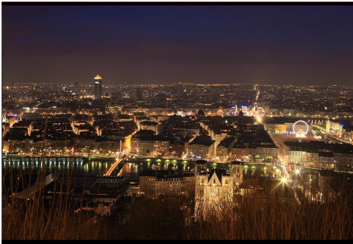
Vue de la ville de Lyon la nuit (document 2)

Les zones éclairées sur l'image correspondent aux zones très peuplées. Il s'agit des villes.