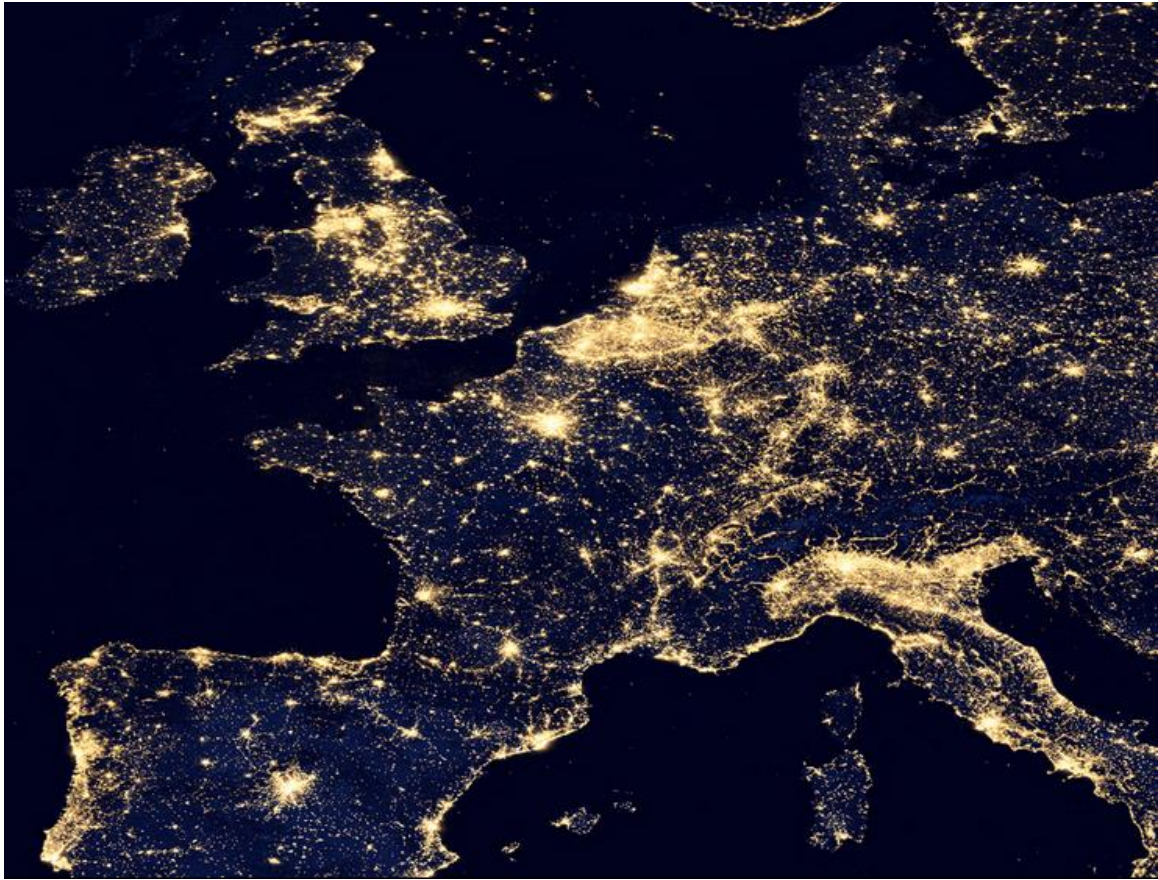
Photographie de la France la nuit, prise par satellite. (document 1)

Observe cette photographie de la France, la nuit.