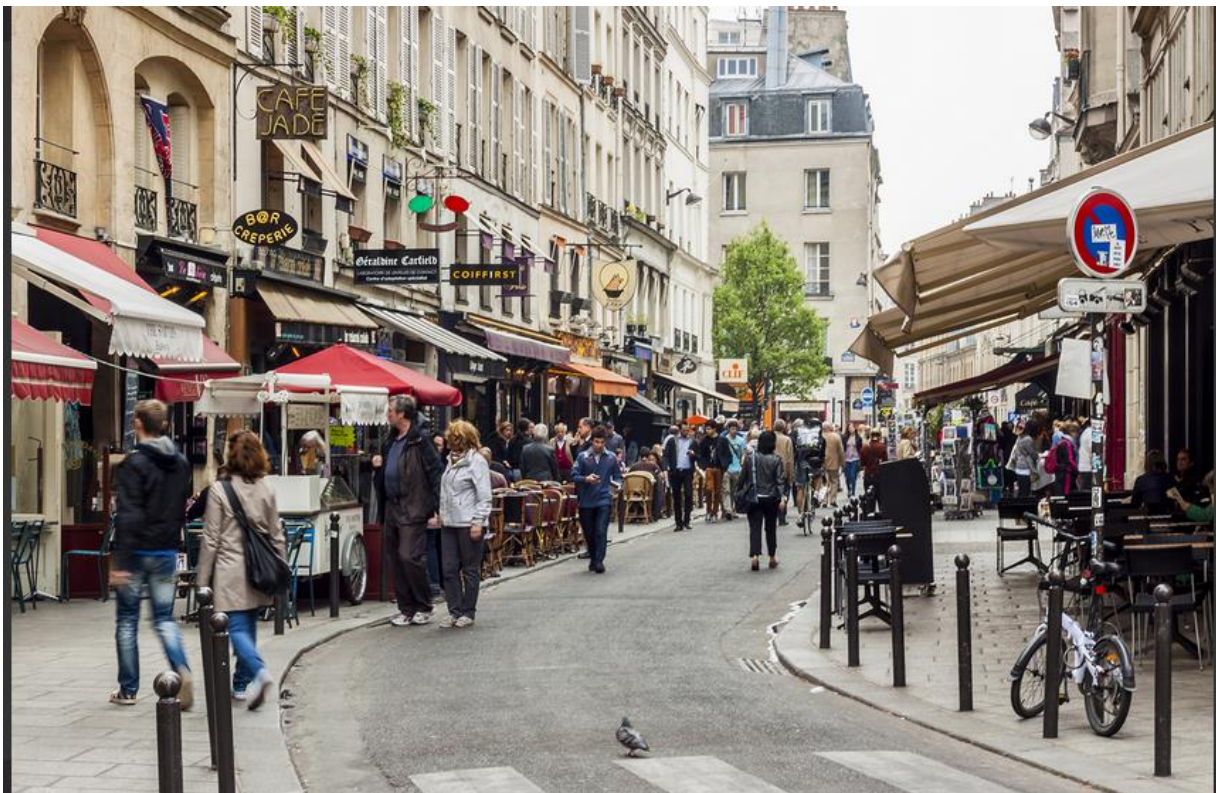
Rues de Paris (avril 2013) (document 4)

Au cours du XIXe siècle, la révolution industrielle, incite les habitants de la campagne à s'installer en ville pour y trouver du travail. C'est l'exode rural . Pour accueillir des habitants plus nombreux, les villes s'agrandissent. Aujourd'hui presque 80% de la population vit dans les villes.