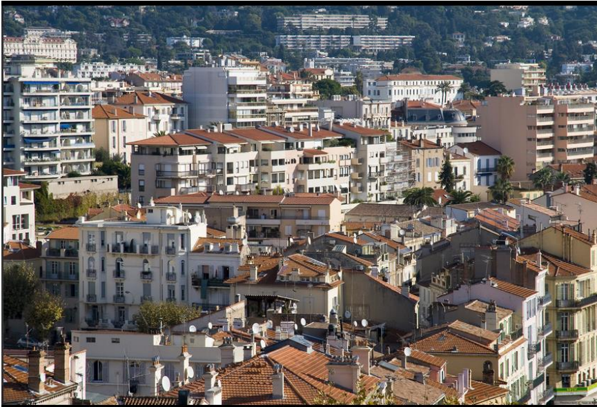
Immeubles du centre-ville de Cannes (document 7)

Le paysage urbain est souvent dégradé par les immeubles.