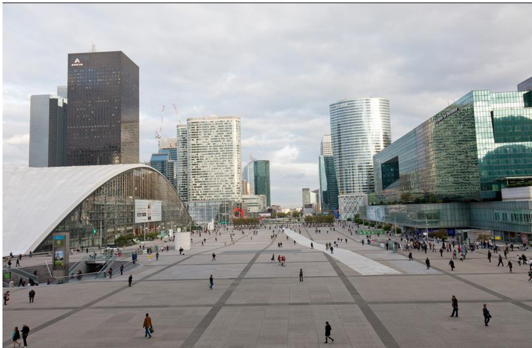
Quartier d'affaires de la Défense près de Paris (document 5)